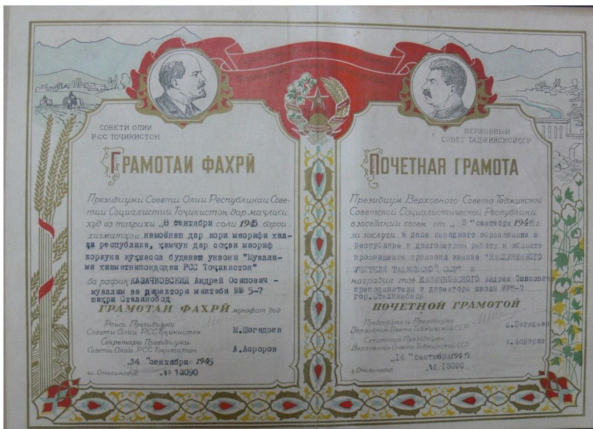
Рис. 19. Почесна грамота Президії Верховної Ради Таджикицької РСР від 14 вересня 1945 р.