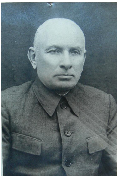
Рис. 18. А. Й. Козачковський. Фото 1954 р.