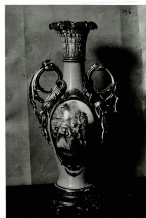
Рис. 7–11. Окремі експонати відділу художньої промисловості в експозиції Переяславського міжрайонного краєзнавчого музею. Серпень 1935 р.