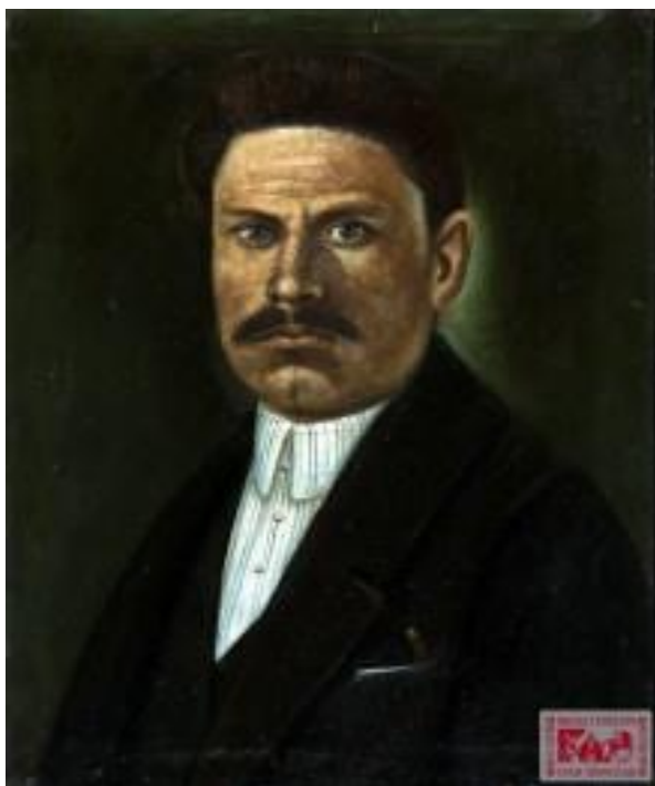
Рис. 17. Картина Панаса Ярмоленка «Портрет Івана Литяка» (1935 р.) із зібрання Національного центру народної культури «Музей Івана Гончара» у Києві.