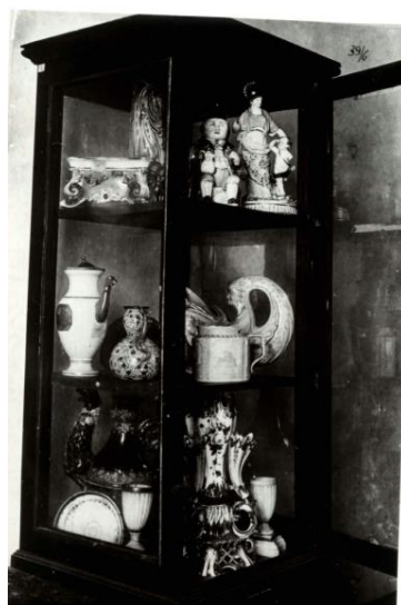
Рис. 6. Вітрина відділу художньої промисловості в експозиції Переяславського міжрайонного краєзнавчого музею. Серпень 1935 р.