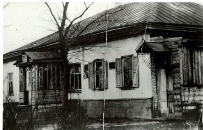
Рис. 1. Переяслав-Хмельницький історично-краєзнавчий музей – колишній будинок А. О. Козачковського. Фото 1950 р.

Key words: Pereiaslav Archaeological and Local Lore Museum, museum work, Andrii Kozachkovskyyi, NHER «Pereiaslav», students' folklore.