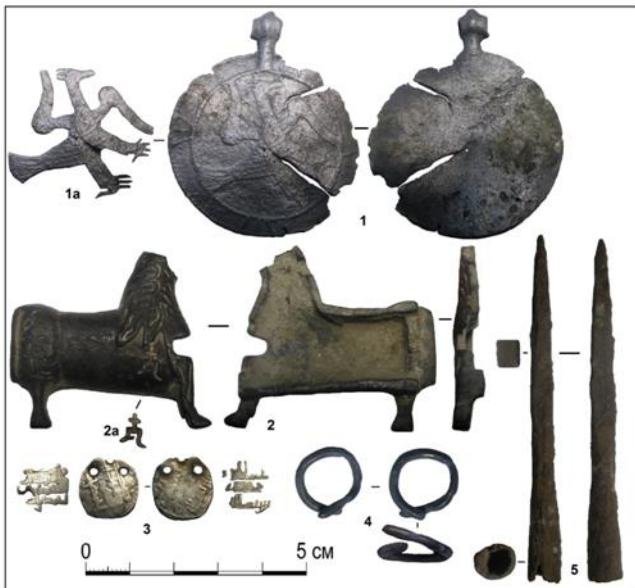
Рис. 8. Знахідки з досліджень 2019 р.: 1-4 – кольоровий метал, 5 – залізо