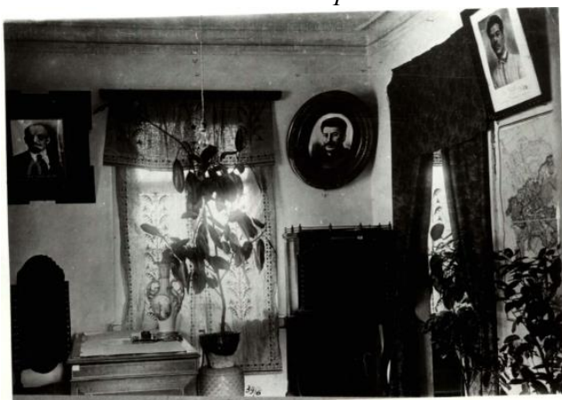
Рис. 3. Приймальня Переяславського міжрайонного краєзнавчого музею. Серпень 1935 р.