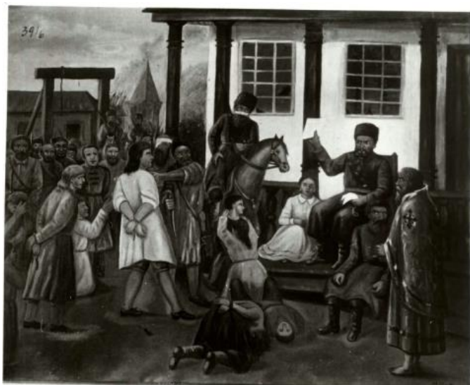
Рис. 5. Картина невідомого художника в експозиції Переяславського міжрайонного краєзнавчого музею. Серпень 1935 р.