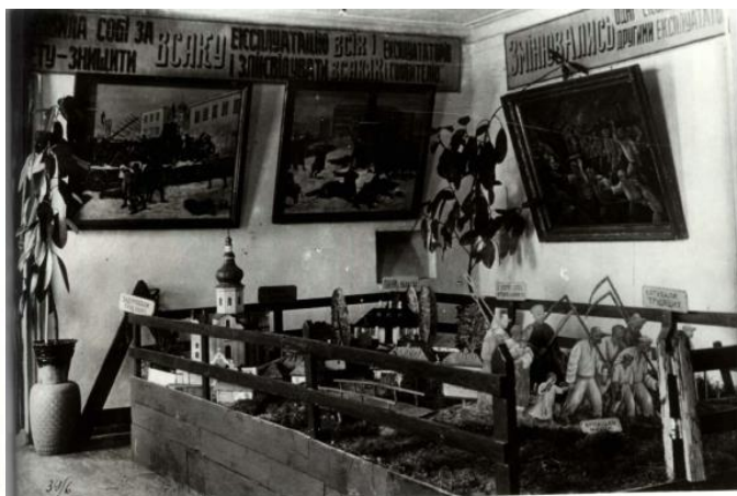
Рис. 4. Фрагмент експозиції Переяславського міжрайонного краєзнавчого музею: «Макет села часів кріпацтва». Серпень 1935 р.