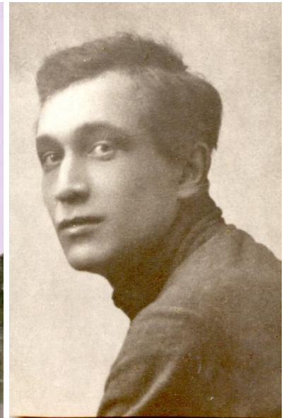
Рис. 14. В. Г. Заболотний. Фото 1922 р.