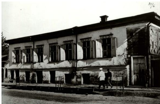
Рис. 2. Переяславський міжрайонний краєзнавчий музей. Серпень 1935 р.