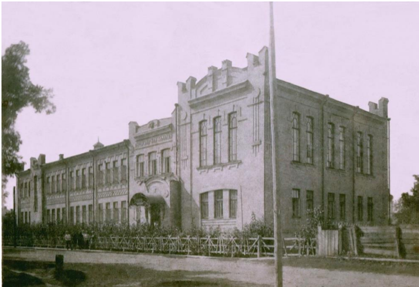
Рис. 13. Будівля Переяславської гімназії, у якій у 20-их рр. ХХ ст. розміщувався Переяславський археологічно-краєзнавчий музей. Фото початку ХХ ст.